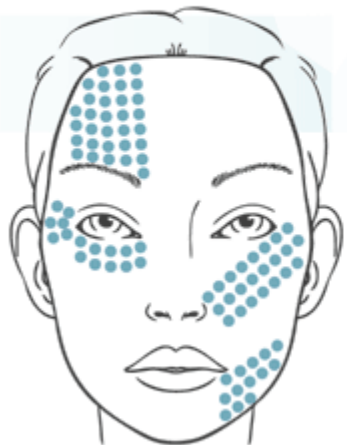
Усталый тип старения