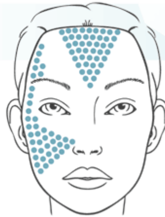
Деформационный тип старения