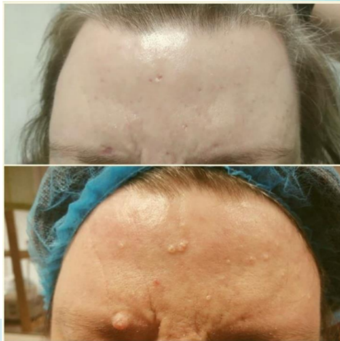
Фото 5. Восстановление кожи на препарате Kiara Reju после лазерного удаления милиумов и фибромы