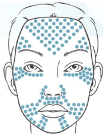
Мелкоморщинистый тип старения